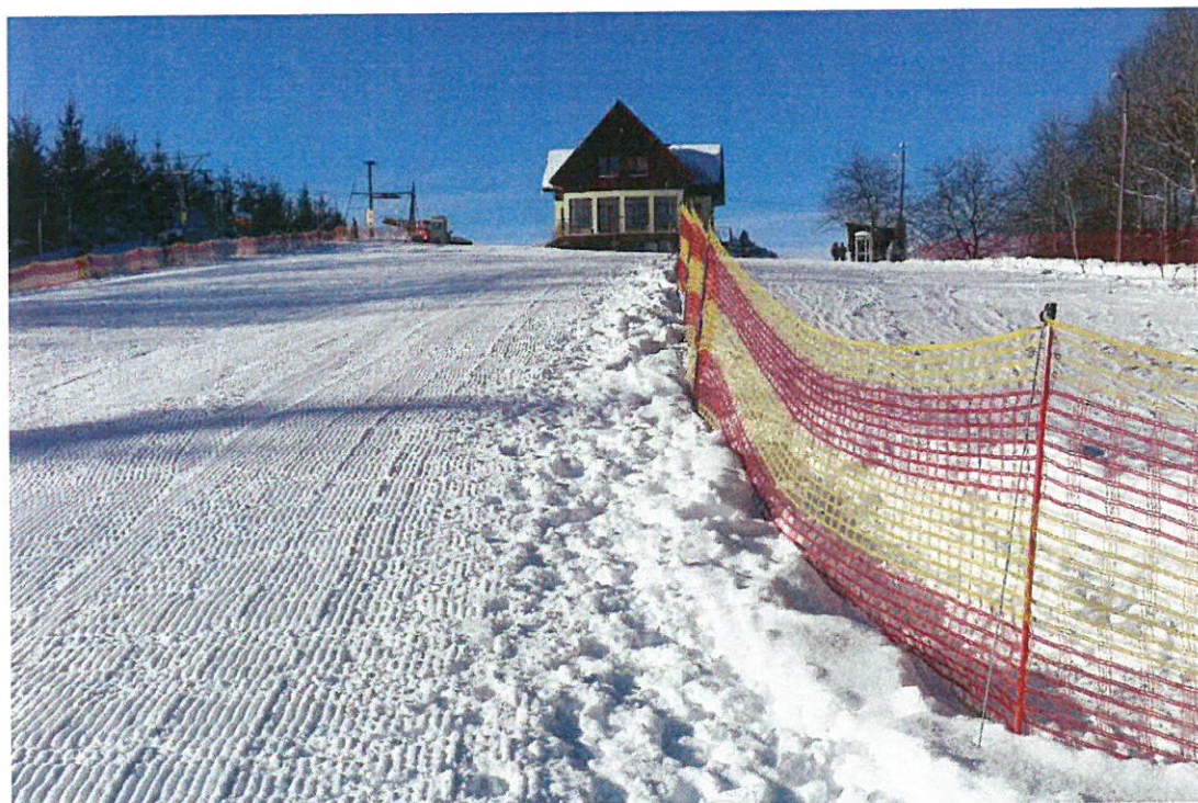
Wyciąg narciarski STAS