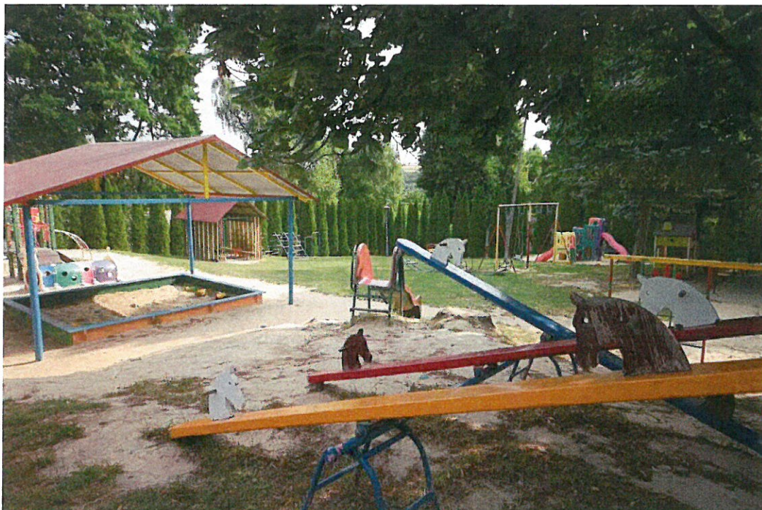
Plac zabaw przy Przedszkolu