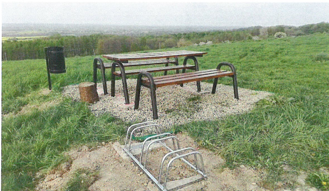
Trasa rowerowa (punkt postoj)