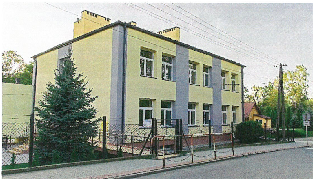
Zespół Szkolno- przedszkolny