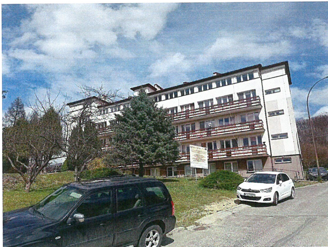
Zakład - Opiekuńczo- Leczniczy